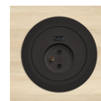
2 boîtiers électriques 1 prise 220 V + 1 USB A 5V. Coloris assorti au piétement.