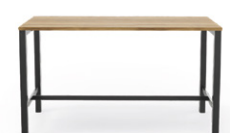
1 table rectangulaire