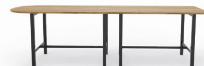
1 élément de départ + 1 élément suivant