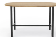
1 table arrondie