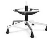
Piètement Alu Poli