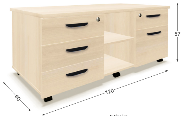
5 tiroirs 4 tiroirs + 1 tiroir DS + 2 niches