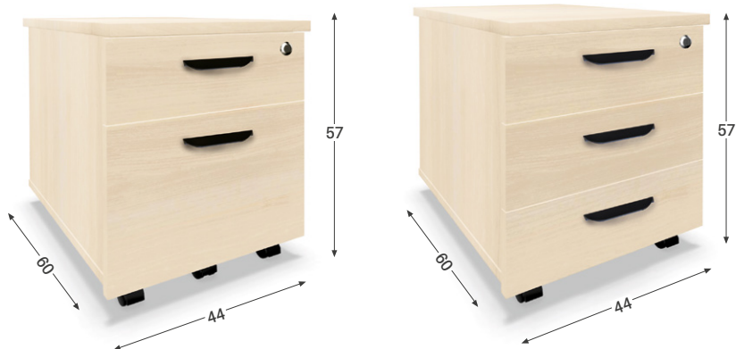
2 tiroirs 1 tiroir + 1 tiroir DS