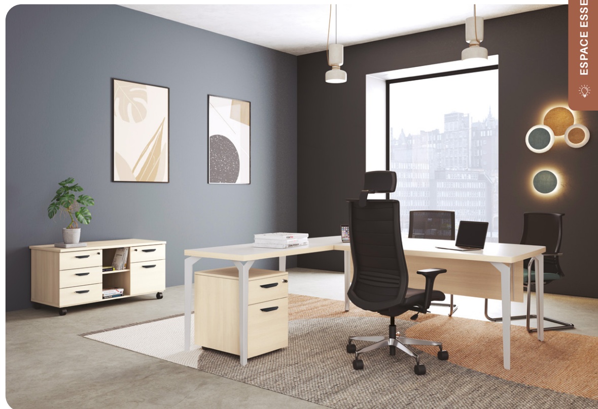
WA Walnut Ambré