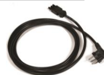
Cordon d'alimentation – CTPEL3 L. 3m