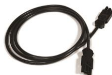
Cordon de raccordement entre boitiers – CRTPEL2 20 L. 2m