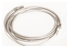
Câble RJ 45 – Cat.6 – RJ45 20 L. 2m